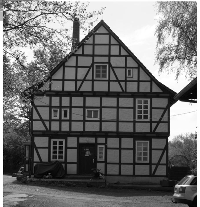
Im Wohngebäude sollen Gruppen- und Seminarräume entstehen.

Die große Scheune wird derzeit als Lagerfläche für die Forstwissenschaften genutzt, die Pläne des Gebäudemanagements sehen für dieses Gebäude u.a. einen Hörsaal mit ca. 170 Plätzen und große Seminarräume vor. Zumindest für diesen Hörsaal wäre die neue Lage sicherlich auch von Vorteil, da dieser vor allem für die Forstwissenschaften benötigt wird, deren größter Hörsaal derzeit nur 100 Plätze hat. Das große Fachwerkhaus ist derzeit als Wohngebäude vermietet. Dieses Gebäude wäre vor allem für die kleineren Seminar- und die Gruppenarbeitsräume vorgesehen. Außerdem besteht die Idee, im Erdgeschoss eine Gastronomie einzubauen. Im Sommer könnte ein neu-